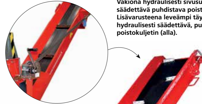
Vakiona hydraulisesti sivusuunnassa säädettävä puhdistava poistokuljetin. Lisävarusteena leveämpi täysin hydraulisesti säädettävä, puhdistava poistokuljetin (alla).