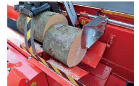
Ohjauslevyjen avulla lyhyimmätkin puut putoavat hallitusti halkaisukouruun.