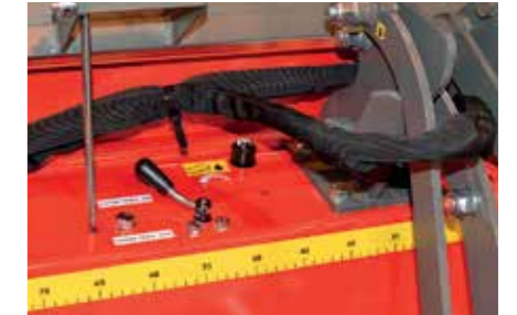
Sähköllä toimivan teräöljypumpun määräsäätö on helppoa kuvan säätöruuvilla.