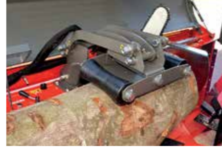
Hydraulinen puunpainin mahdollistaa kaikenkokoisten puiden helpon sahauskeskityksen.

Uutuudessa on useita käytönaikaisia kuluja alentavia ominaisuuksia. Suuri öljytilavuus mahdollistaa pidemmät öljyn vaihtovälit ja keskeytymättömän työskentelyn kaikissa olosuhteissa aina Alaskasta Australiaan. Sähköinen, varmatoiminen ohjaus vähentää huoltoa tarvitsevien kohteiden määrän minimiin. Teräketjun voiteluöljyn määrän säätö on helppoa, jolloin sitä ei kulu turhaan. Kanisteria vaihtamalla öljyä ei ole tarpeen kaataa säiliöstä toiseen. Koneen voimansiirrossa ei käytetä lainkaan kiilahihnoja, jolloin kone pysyy vuodesta toiseen yhtä luotettavana ja suorituskykyisenä.