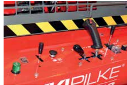
Koneen toimintojen ohjaus helppokäyttöisellä ja ergonomisella ohjauspaneelilla.