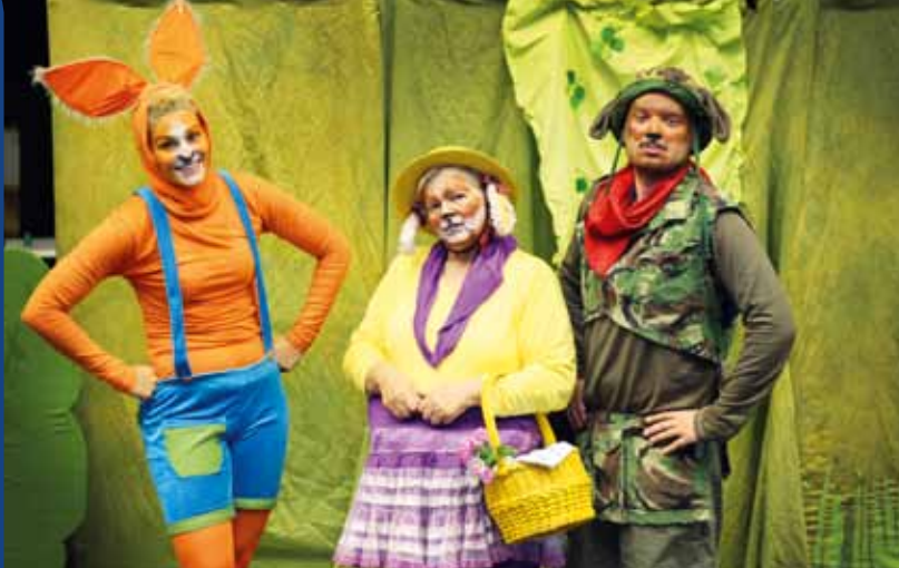
Minä, Puff Kuurojen Liitto ry, Teatteri Totti

Hjördis Anna Haraldsdóttir/ koulutus- ja tulevaisuusfoorumi