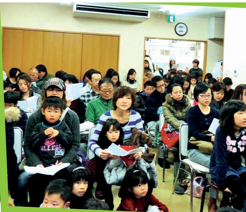
Joulun sanoma on koskettanut japanilaisia. Vanhat tilat ovat ahtaat. Rakennamme kasvavalle seurakunnalle kirkkoa.