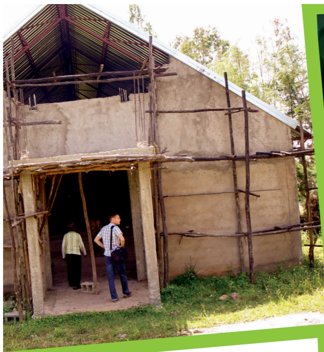
Kansanlähetyksen tukea kirkkojen rakentamista Etiopiassa.