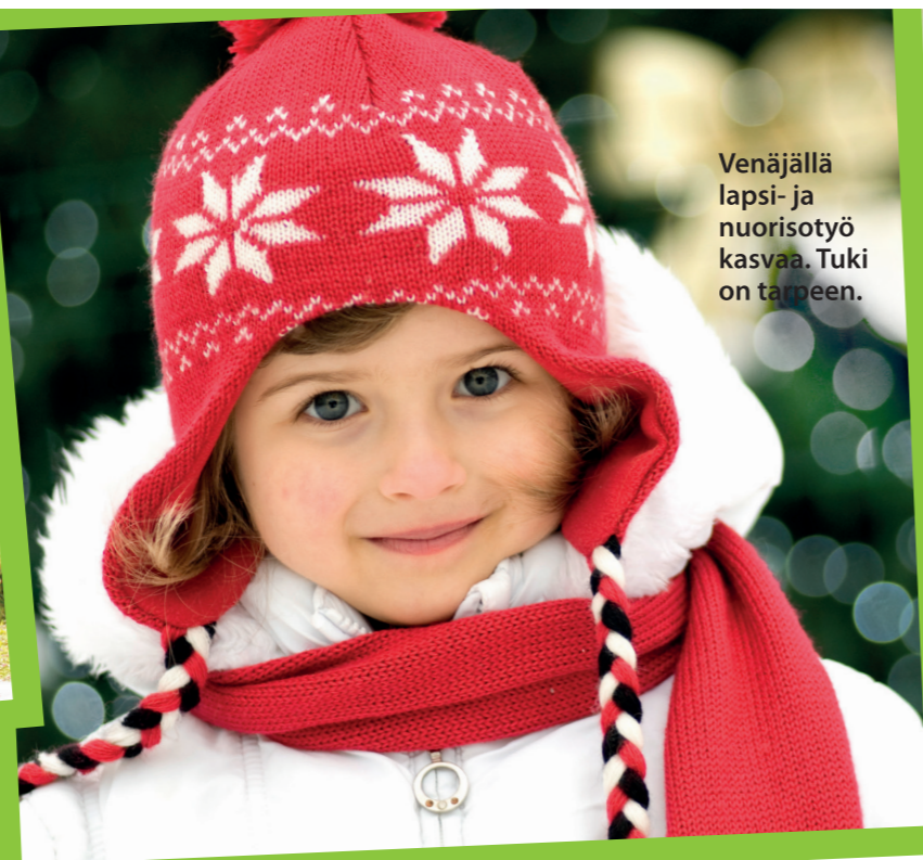
Venäjällä lapsi- ja nuorisotyö kasvaa. Tuki on tarpeen.