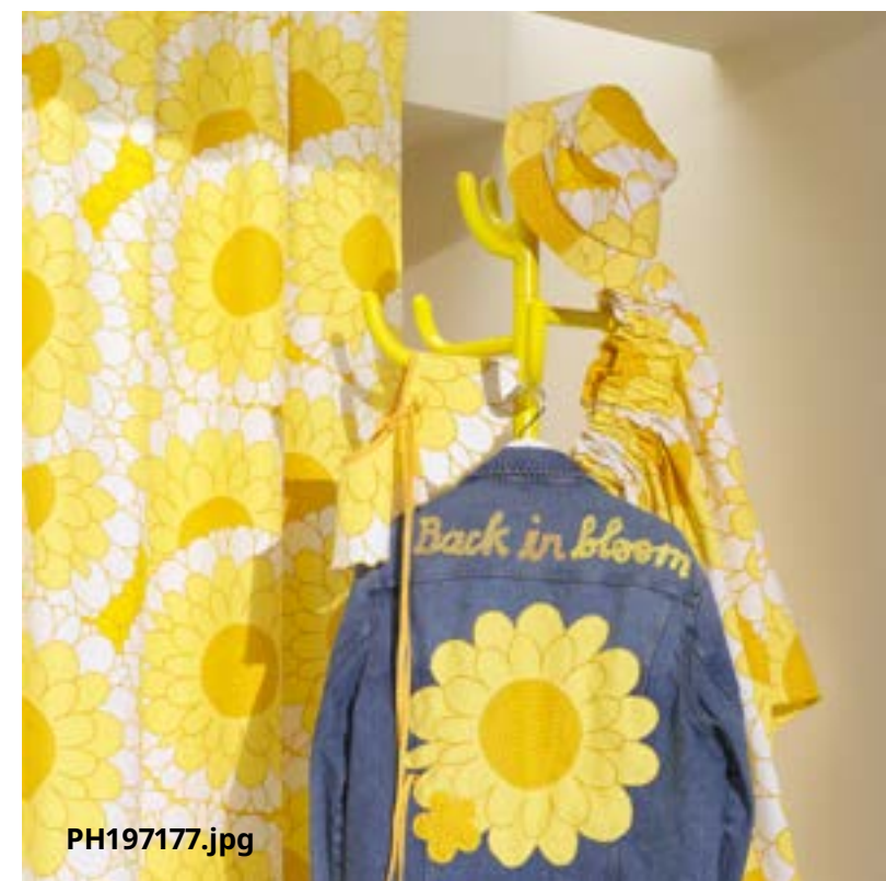
Määrämittainen SANDETERNELL-kangas vuonna 2024