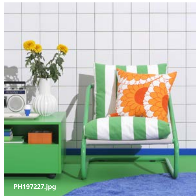
Ylhäällä: Ingvar Kamprad GOGO-lepotuolissa vuonna 1971 Alla: ÖNNESTAD-lepotuoli vuonna 2024