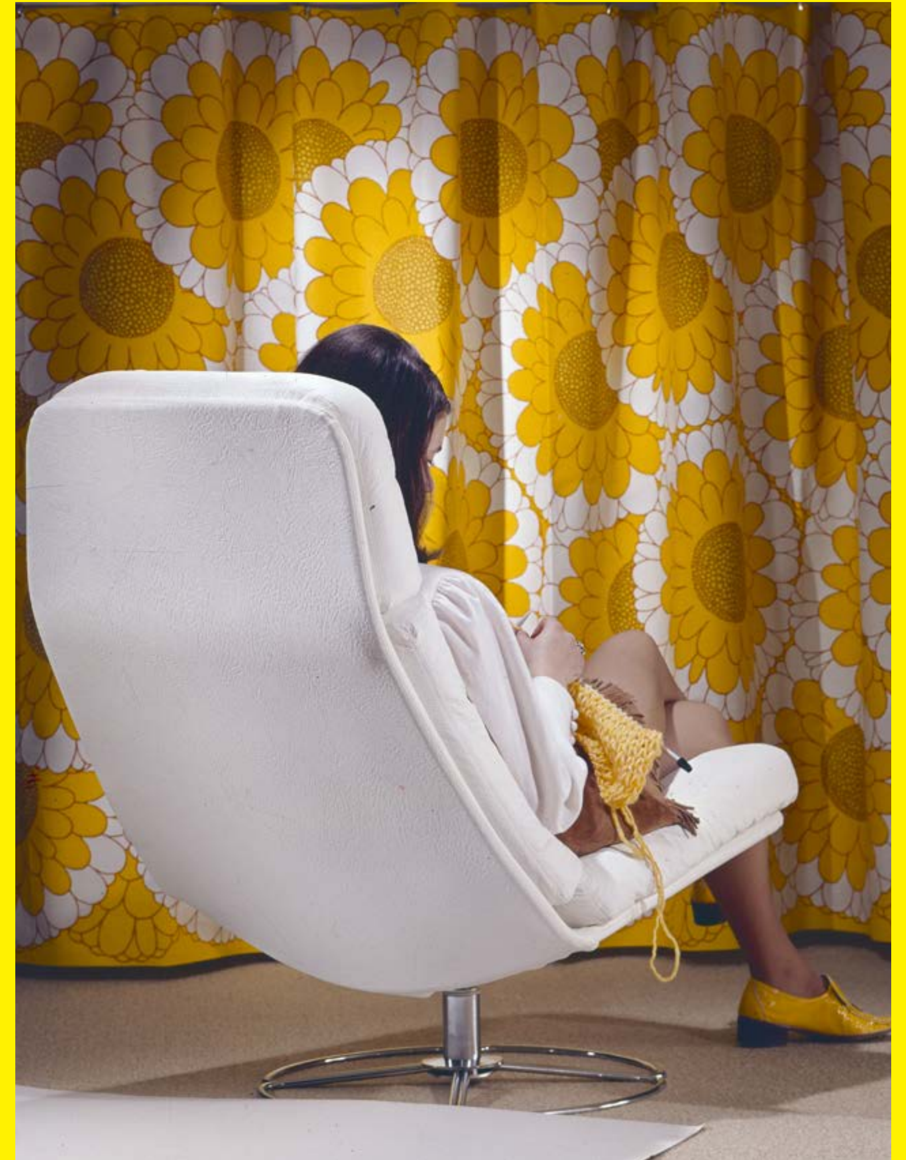
MAJSOL-verhot vuonna 1971