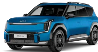
Ocean Blue (vain GT-Line) (OBM) Mattaväri****