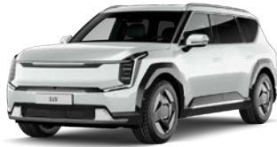
Snow White Pearl (SWP) Helmiäisväri