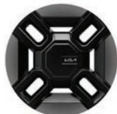
EV9 GT-Line 21" kevytmetallivanne Renkaat: Continental 285/45 R21

****Mattaväriin puhdistus ja ylläpito poikkeaa muista väreistä. Lisätietoja jälleenmyyjältä.