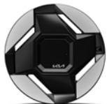
EV9 19" kevytmetallivanne Renkaat: Nexen 255/60 R19