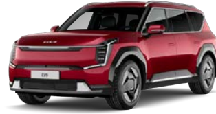
Flare Red (C7R) Metalliväri