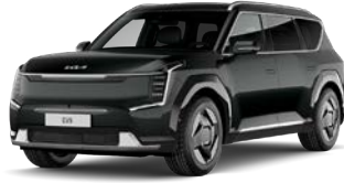
Aurora Black Pearl (ABP) Metalliväri