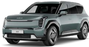
Iceberg Green (IEG) Metalliväri