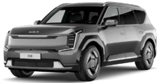
Pebble Gray (DFG) Perusväri