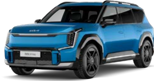
Ocean Blue (vain GT-Line) (OBG) Metalliväri