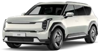
Ivory Silver (vain EV9) (ISG) Metalliväri