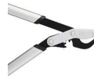
PowerGear X raivaussakset ohileikkaava L LX98 tuotekoodi 1020188 hinta 98,90 e