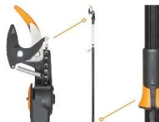
PowerGear X monitoiminen teleskooppileikkuri UPX86 tuotekoodi 1023624 hinta 149,90 e