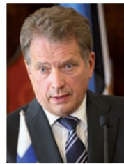
Tasavallan presidentti Sauli Niinistö

Avajaisia voi seurata suorana lähetyksenä: sairaanhoitajat.fi