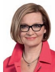
Ministeri Paula Risikko

Sessioiden sisällöt ja luennoitsijat löydät seuraavilta sivuilta.