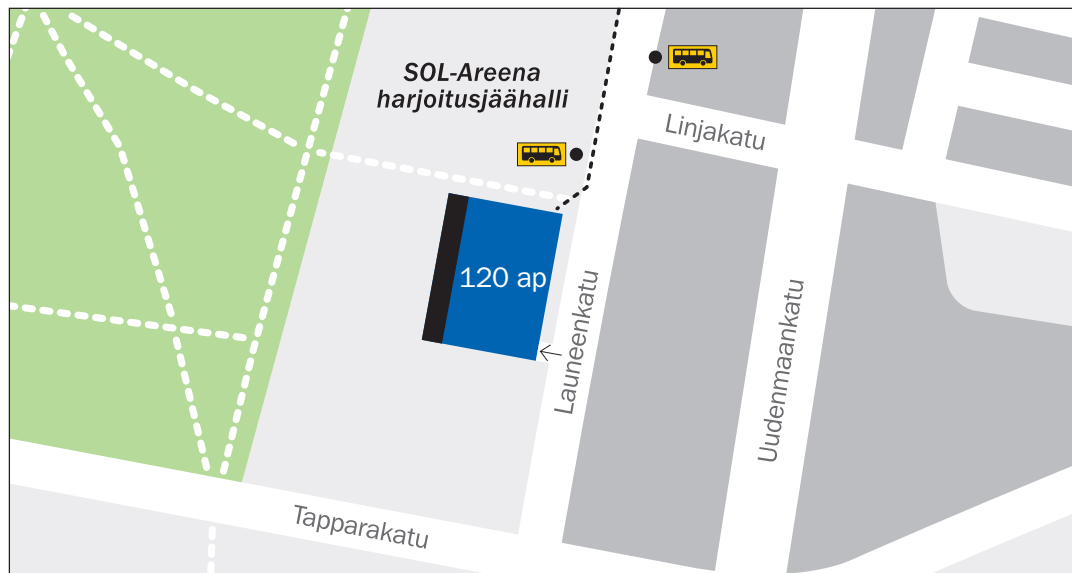
Launeen hiikkakentän maksuton liityntäpysäköintialue, Launeenkatu 9.