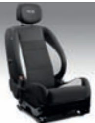
KAKSIVÄRINEN TEKSTILIVERHOILU, Tummanharmaa / Vaaleanharmaa