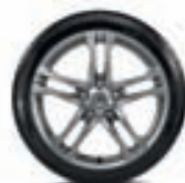
KEVYTMETALLIVANNE 18" AX-L