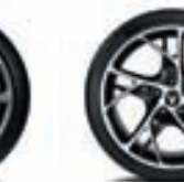
KEVYTMETALLIVANNE 19" STEEV