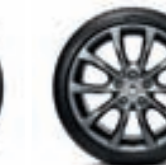
KEVYTMETALLIVANNE 18" KEZA