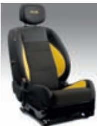
KAKSIVÄRINEN TEKSTILIVERHOILU, Keltaiset yksityiskohdat