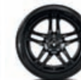
KEVYTMETALLIVANNE 18" AX-L, MATTAMUSTA