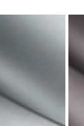
CASSIOPEE Harmaa **