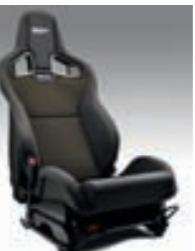
RECARO®-TEKSTILIVERHOILU, Harmaat yksityiskohdat