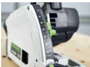
Kuva: Festool-TS60K-11.jpg Tarkka syvyysäättö: kaksoisosoitin ja hienosäättö takaavat tarkan asetuksen. Tämä tekee parallaksittomasta lukemisesta standardin.