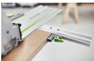
Kuva: Festool-TS60K-16.jpg Huipputarkkuutta sivuohjaimella