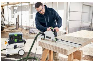
Kuva: Festool-TS60K-10.jpg Upotussahaus järjestelmällä katkaisukiskon, sopivan järjestelmäimurin ja SYS-Powerstationin kanssa.