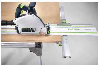
Kuva: Festool-TS60K-15.jpg Sivuohjain FS-PA levyjen optimaaliseen sahaamiseen