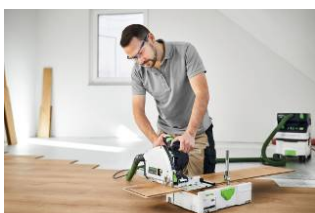
Kuva: Festool-TS60K-12.jpg Katkaisukiskon kanssa sitä voi käyttää entistä joustavammin lattia-asennustöissä.