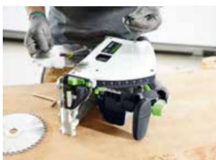
Kuva: Festool-TS60K-09.jpg Sahanterän entistä helpompi vaihtaminen: loppuun asti mietitty rakenne mahdollistaa sahan asettamisen kyljelleen, mikä helpottaa sahanterän vaihtoa. Lisäksi sahanterän ja kiinnityslaipan keskinäisen sovitus varmistaa optimaalisen kiinnityksen.