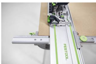
Kuva: Festool-TS60K-17.jpg Huipputarkkuutta sivuohjaimella