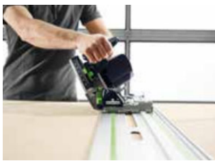
Kuva: Festool-TS60K-08.jpg Tarkkaa työtä myös kulmasahauksissa