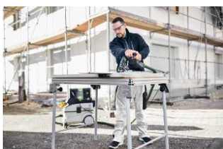
Kuva: Festool-TS60K-20.jpg Uusi TS 60 K on ihanteellinen myös kipsikuitulevyjen tarkkaan sahaamiseen.