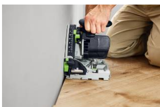
Kuva: Festool-TS60K-13.jpg Tasapintainen runko mahdollistaa sahaamisen reunan lähellä pienellä etäisyydellä seinästä