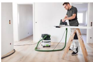
Kuva: Festool-TS60K-19.jpg Uudella TS 60 K:lla voi katkaista paksummatkin ovet.